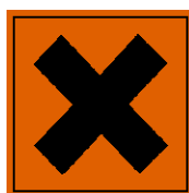
Xi – Lokalirriterende