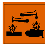
C – Korrosiv